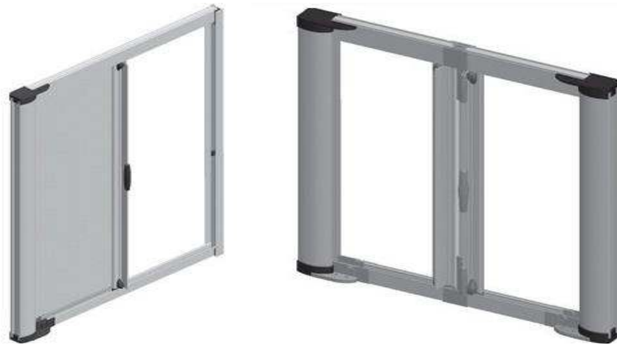
Εικόνα 1: Σίτα Οριζόντιας-επάλληλης κίνησης